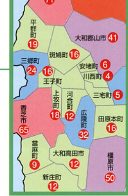
部分拡大図 Partial enlarged drawing